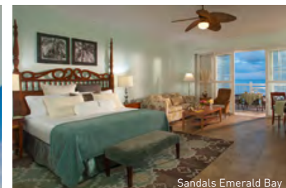
Sandals Emerald Bay