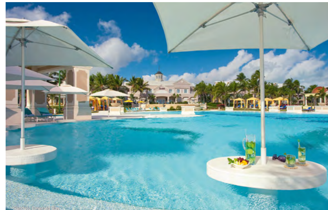
Sandals Emerald Bay