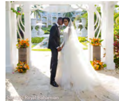
Sandals Royal Bahamian