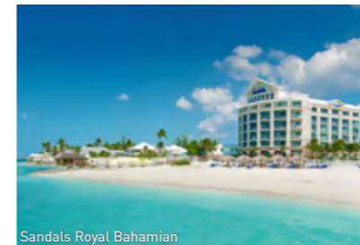
Sandals Royal Bahamian

Kristallklares türkisfarbenes Wasser, weiße kilometerlange Sandstrände, Palmen, die sich sanft in der Brise wiegen. Dies und noch viel mehr finden Sie auf der paradiesischen Inselgruppe der Bahamas. Hier stehen Entschleunigung und pure Entspannung auf dem Programm, insbesondere in den Sandals Resorts mit „adults only“ Konzept. Die Luxus-Resorts bieten Paaren zahlreiche und sehr umfassende All-Inclusive-Leistungen für einen unvergesslichen Traumurlaub. Besonders attraktiv: Ein Bahamas-Urlaub lässt sich optimal an eine USA-Reise anschließen!