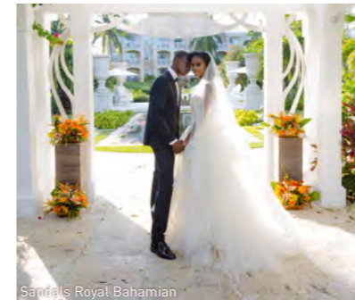
Sandals Royal Bahamian